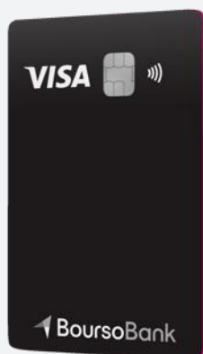
Carte ULTIM Débit immédiat ou différé